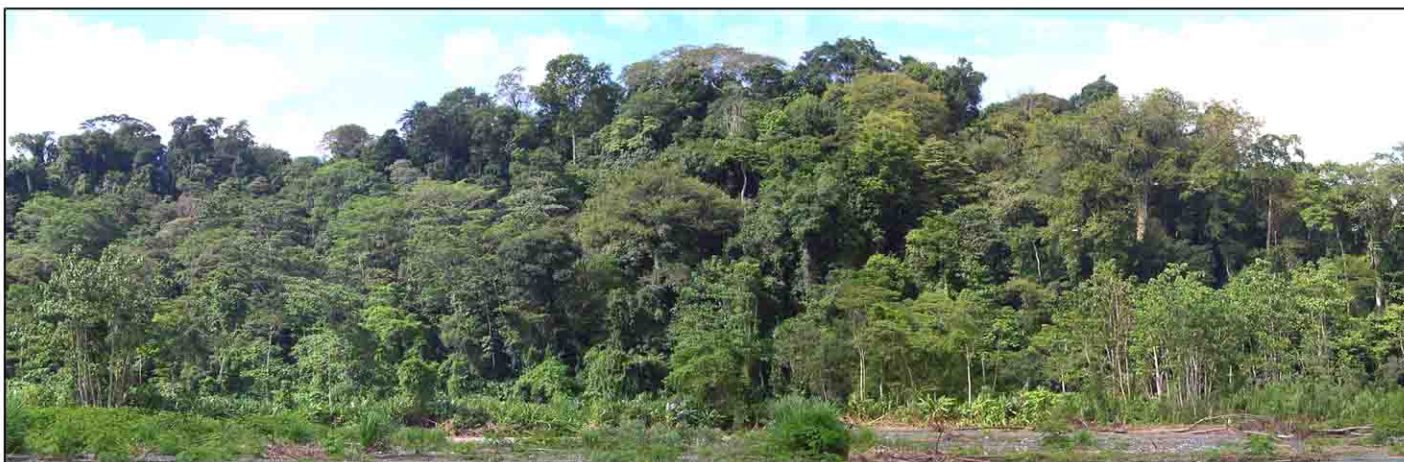
Deštný prales v provincii Maniema v Demokratické Republice Kongo.