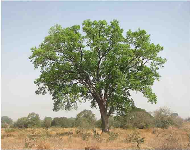
Mahagon, lat. Entandrophragma utile