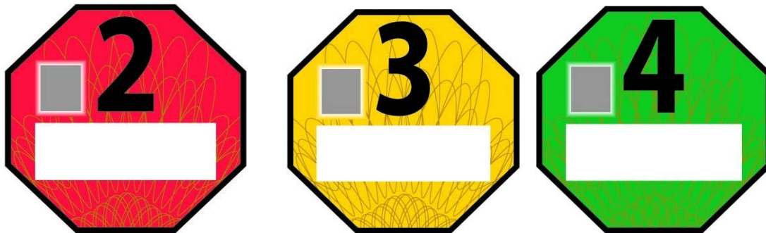
Obr. 1: Vzory emisních plaket